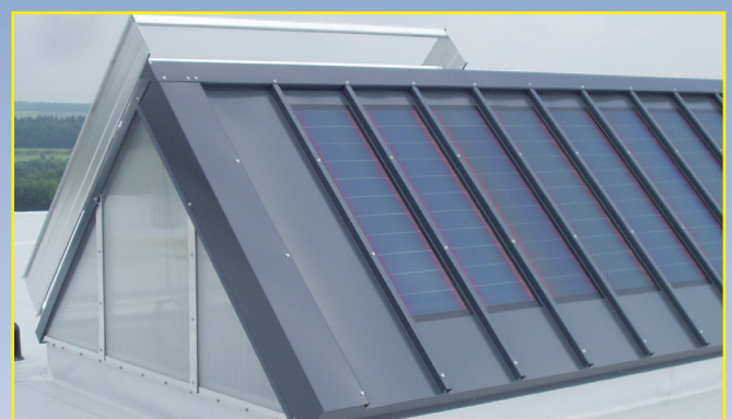
Lichtbandsystem mit einseitigen Solarpaneelen kombiniert.