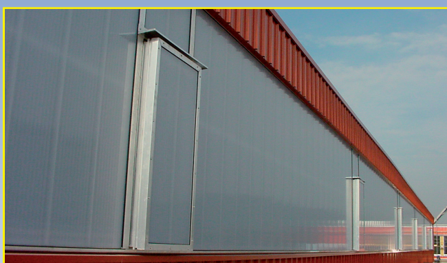
Shedsanierung mit RWA-Lüftungskappen.