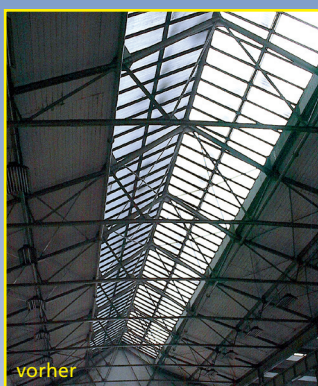
Sanierung mit Skyline.