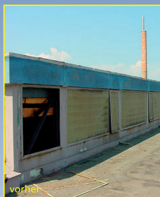
Fassadensanierung mit RWA-Lüftungsklappen.