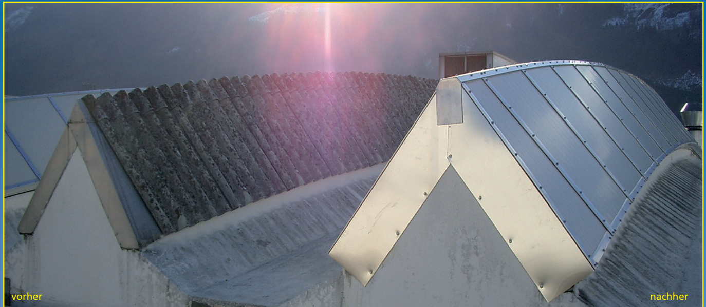
Sanierung mit Shedline.

Für helle Köpfechen hat Indu-Light auch Lichtbandsysteme kombiniert mit Photovoltaik im Angebot.