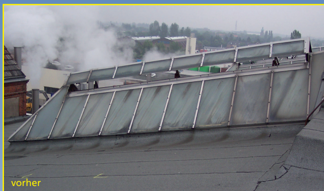
Sanierung mit Skyline.